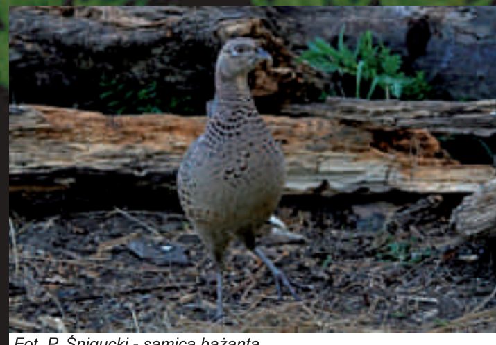
samica bażanta