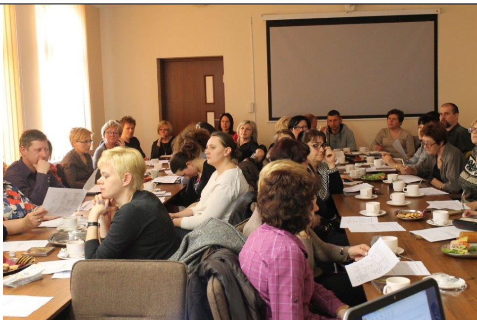
Spotkanie dla nauczycieli uczących w kl. IV-VI SP