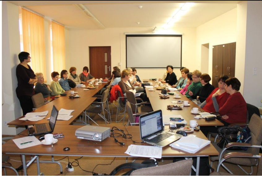
Spotkanie dla nauczycieli uczących w kl. I-III SP