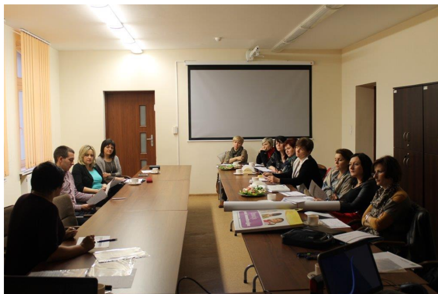
Spotkanie dla nauczycieli przedszkoli