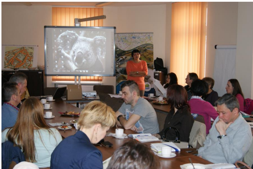
Spotkanie dla nauczycieli gimnazjów i szkół ponadgimnazjalnych