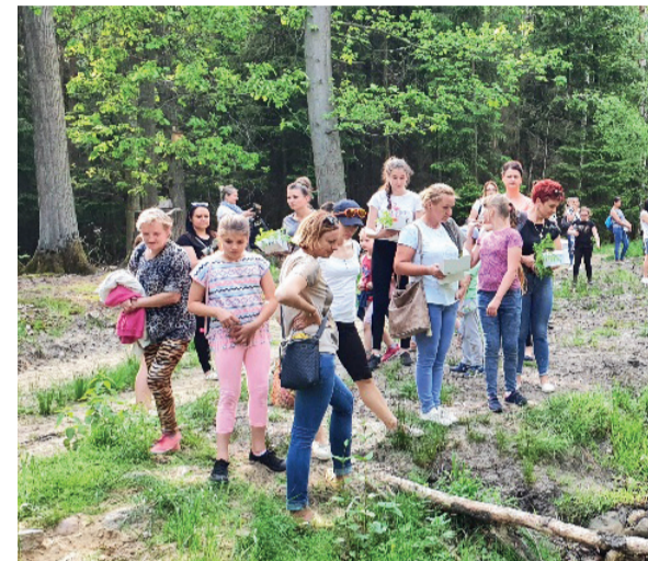
Szkoła Podstawowa w Garkach na zajęciach w terenie – Campus D

Najliczniej pojawiającymi się argumentami za udziałem w zajęciach jest ich atrakcyjność oraz to, że pozwalają na rozszerzenie wiedzy. Nauczyciele wysoko oceniają komunikatywność i kompetencje edukatorów oraz przygotowanie ośrodków, wskazują również, że wysokość opłat za wstęp jest adekwatna do jakości oferty.