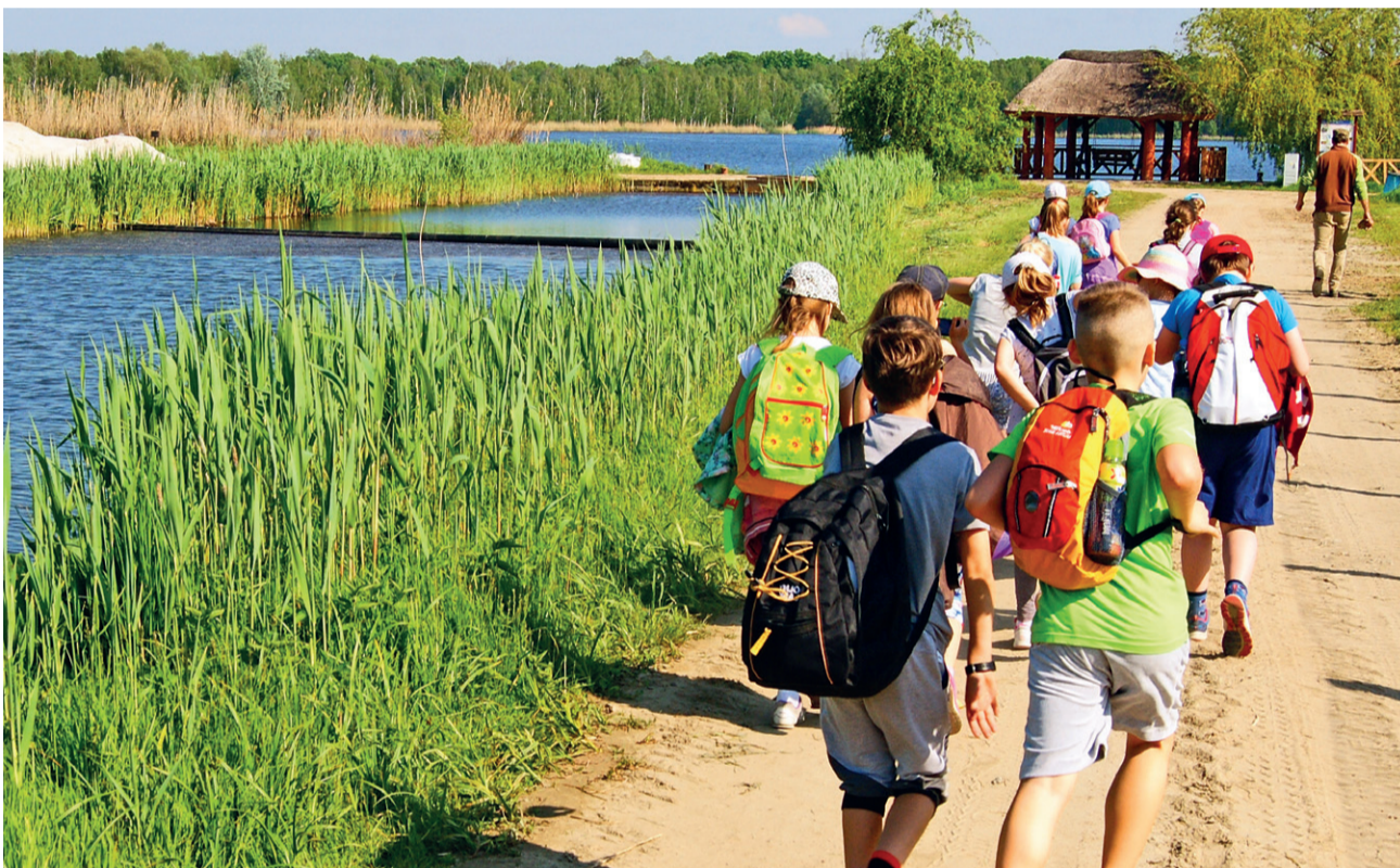
Zajęcia w Gospodarstwie Ruda Żmigrodzka.

Edukacja dla Doliny Baryczy to jeden z najważniejszych celów realizowanej od 2016 roku przez Stowarzyszenie „Partnerstwo dla Doliny Baryczy” Lokalnej Strategii Rozwoju.