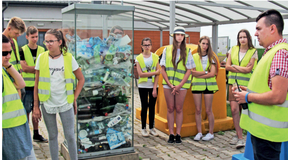
Finaliści Konkursu Wiedzy o Dolinie Baryczy na wycieczce w ZZO Olszowa.

Poprzez gry i zabawy edukacyjne uczestnicy ćwiczyli m.in. zginięcie butelek, korzystanie