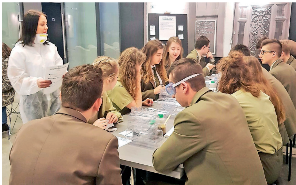
Uczniowie milickiego Technikum Leśnego w trakcie Misji ekoDOM.