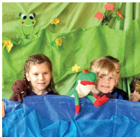
Mali aktorzy ze szkoły w Pawłowie w przedstawieniu „Nad polską wodą”.

Organizatorzy założyli, że niecodzienna aktywność, jaką jest teatr, zachęci dzieci i młodzież do bliższego przyjrzenia się środowisku lokalnemu, wzbudzi zainteresowanie przyrodą, uświadomi na otaczające nas piękno. A co za tym idzie, przedszkolaki i uczniowie w przyszłości chętniej zadbają o środowisko i bliską im naturę.