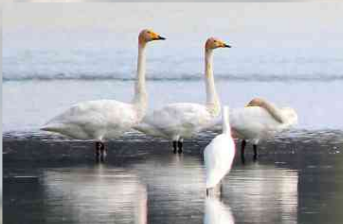
Łabędź krzykliwy

Łabędzie są uważane za jedno z największych polskich ptaków latających. Oczywiście samice są mniejsze i lżejsze. Mimo wrodzonego wdzięku i pozornej łagodności potrafią skutecznie zniechęcić napastnika, zwłaszcza broniąc swych młodych, niejednokrotnie machnięciem skrzydła potrafiły złamać rękę człowiekowi, nie wspominając o bolesnym poszczypaniu mocnym dziobem. Podczas pierzenia, czyli zrzucania