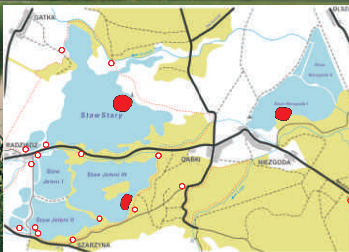
STAWY MILICKIE- KOMPLEKS RADZIĄDZ MIEJSCE OBSERWACJI ŁABĘDZI