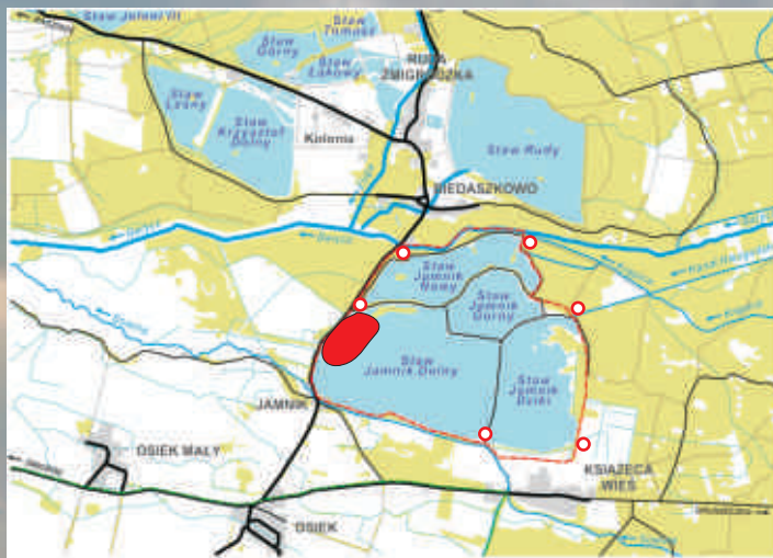
STAWY MILICKIE- KOMPLEKS JAMNIK MIEJSCE OBSERWACJI ŁABĘDZI