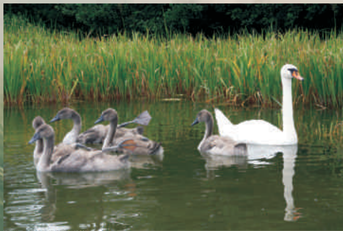
Łabędź niemy

wszystkich lotek, raz do roku stają się niezdolne do lotu przez 6-8 tygodni. Panuje powszechne przekonanie, że łabędzie łączą się w pary na całe życie, jednak zdarzają się wśród nich „zdrady”.