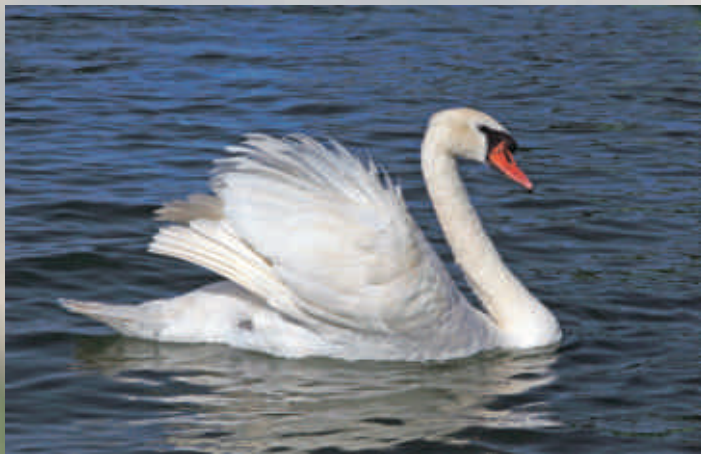
Łabędź niemy

Dostojnie pływające po Stawach Milickich przypominają statki o białych żaglach. Młode osobniki to „brzydkie kaczątka” upierzenie mają szare, z czasem bielejące ale ze sporą ilością jakby brudnych piór.