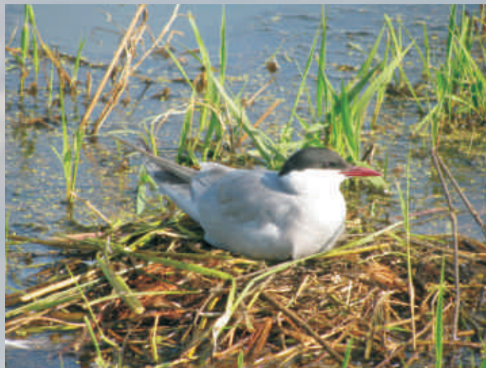
Rybitwa rzeczna

Gniazdo jest bardzo płytkie i bywa przemoczone. Samiec i samica wysiadują jaja na zmianę. Pisklęta zaczynają latać po około 25 dniach od wyklucia i szybko się usamodzielniają.