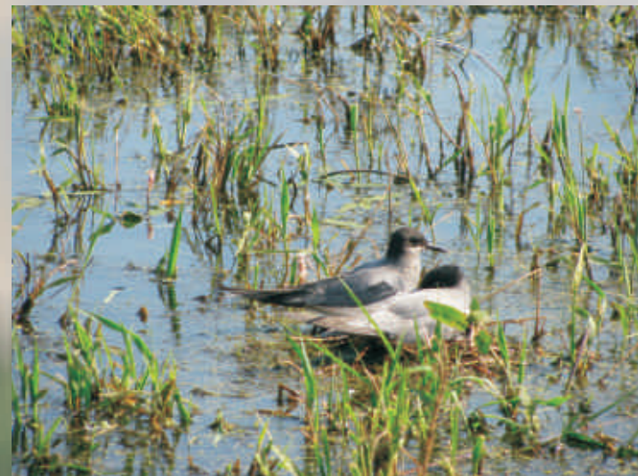
Rybitwa czarna

Śmiały, zwinny łowca unoszący się nad powierzchnią wody. Gdy poluje w dużej grupie, przypomina nieco swym zachowaniem jaskółkę. Nawet jej łacińska nazwa pochodzi od jaskółki. Jest niewielkim, dosyć ciemno upierzonym ptakiem. W odróżnieniu od innych, „jaśniejszych” rybitw ma krótszy ogon i krótsze skrzydła.