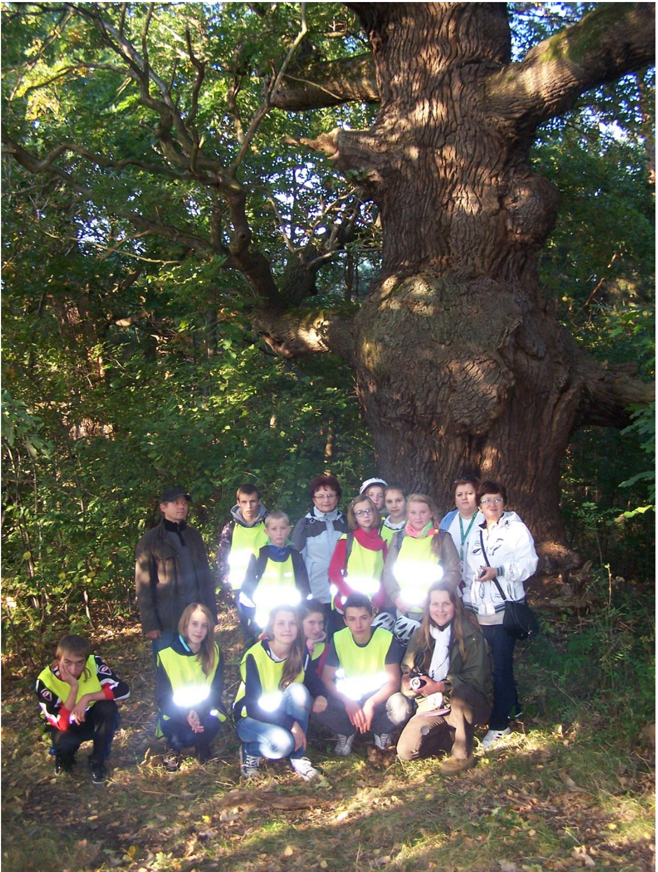
Dąb Henryk i nasza wycieczka